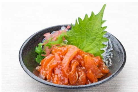
富士山サーモンユッケ

伊豆で獲れた脂の乗った金目鯛を、丸ごと一匹煮付けました。特殊製法により身はふっくら柔らかく、身崩れも少ない仕上がり、佐政水産自慢の逸品です。湯煎又は電子レンジで温めていただくだけで簡単にお召し上がり頂けます。