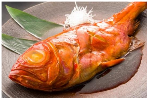
金目鯛丸ごと煮付け

[商品名] 金目鯛丸ごと煮付け [入数/価格] 1P(約 600g) / 3,240 円(税込)