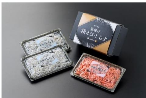
釜揚げ桜えび・しらすセット

富士山の伏流水で3年かけて育てた「富士山サーモン」に、甘辛いタレとごま油を加え、ユッケに仕上げました。モチモチの食感と、ユッケの風味が病みつきになる自慢の一品です。