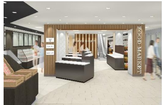
生鮮エリア「フードマーケット」(イメージ)